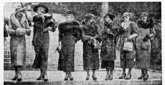
Die neugegründete Arbeitsgemeinschaft des modischen Handwerks in Berlin veranlaßte ihre erste Modenschau, auf der u. a. diese neuesten Modenschöpfungen für Herbst und Winter vorgeführt wurden