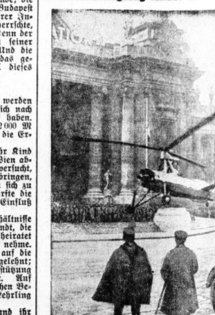
Die Pariser Polizei hat zur Überwachung des Verkehrs ein Windmühlentzug in ihren Dienst gestellt. Das Flugzeug stellte seine Verwendbarkeit als Beweis, indem es auf den Champs Elysees Landung vornahm.