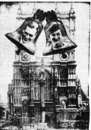
Bezeichnend für die freudige Stimmung der Engländer anlässlich der Hochzeit des Prinzen Georg mit der Prinzessin Marina von Griechenland ist diese Aufnahme, die das glückliche Paar in den Glocken der Westminster Abtei (im Hintergrund) in Erwartung der Hochzeit am 29. November zeigt.

Das Vertrauen auf die Wiederkehr einer friedlicheren Zeit im Wirtschaftswesen ist in London seit der Eintommenkammer-Reform vom April fertig geworden. Man findet dieses Vertrauen überall, wo man antippt; an unumkehrbaren natürlichen in den Geschäftskreisen. London, sagt man, ist eine Stadt aus vielen Völkern. Jedes der Völker hat sein eigenes Charakteristikum. Aber der Wohlstand, soweit er eben existiert, trifft sich nur im West End, in Regent Street oder Bond Street. Der Geschäftsführer eines international bekannten Warenhandelsgeschäftes zählt mit einer Reihe von Sorten und Bezeichnungen, deren Vater ihnen dort gekauft haben, und die jetzt, nach langen Jahren,