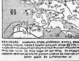
Wetterkarte bis 26. November abends. Am 26. November: Wollos, zeitweise leichte Niederschläge, anfangs noch mild, dann kälter werdende West- bis Nordwestwinde. Später Temperaturrückgang um 2 bis 3 Grad und Übergang zu Schneewetter.

Vorauslicht. Wetter bis 26. November abends. Am 26. November: Wollos, zeitweise leichte Niederschläge, anfangs noch mild, dann kälter werdende West- bis Nordwestwinde. Später Temperaturrückgang um 2 bis 3 Grad und Übergang zu Schneewetter.