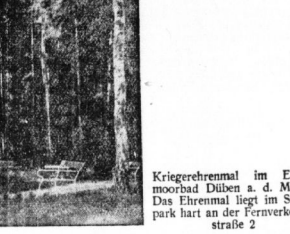
Kriegerehrenmal im Eisenmoorbad Düben a. d. Mulde. Das Ehrenmal liegt im Stadtpark an der Fernverkehrsstraße 2.