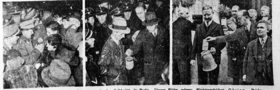
Führende Persönlichkeiten sammelten am Tag der nationalen Solidarität in Berlin. Unsere Bilder zeigen: Ministerpräsident Göring, Reichsminister Dr. Goebbels und Dr. Schacht während der Sammlung.

Die Verhandlungen haben sich in der Sitzung des 8. Dezember mit dem Streitfall zwischen Jugoslawien und Ungarn beschäftigt. Die Sammlungen haben sich in der Sitzung des 8. Dezember mit dem Streitfall zwischen Jugoslawien und Ungarn beschäftigt.