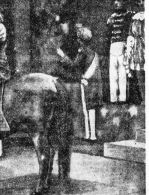
Die Prinzessin auf dem Pony, durch die sie der Wurzelkönig entführt