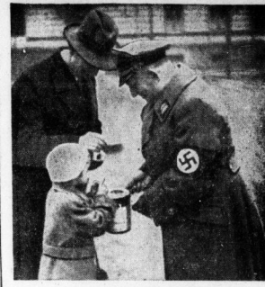
Auch die Kleinsten spendeten. Gauleiter Staatsrat Jordan beim Sammeln.

Die Sammlung der 400. Die große Sammlung: 400 Persönlichkeiten, die im öffentlichen Leben der Stadt Halle am führenden Stelle stehen, würden sie durchführen - das mußte man. Und auch das sie schlagartig überall einziehen würde.