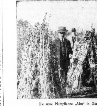
Die neue Nutzpflanze „Mm“ in Garten auf einem der Versuchsfelder