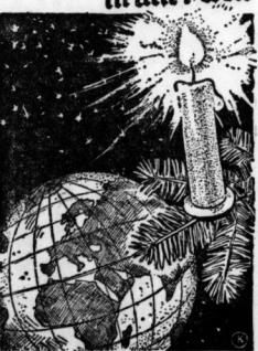
Das blaue Licht in aller Welt