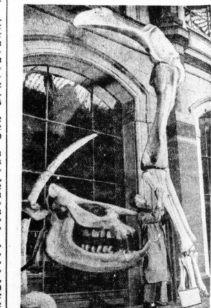
Im Berliner Zoologischen Museum wird zur Zeit an der Rekonstruktion des Skeletts eines riesigen Sauriers aus vorweltlichen Zeiten gearbeitet. Das vor etwa 25 Jahren in Afrika gefunden wurde. Das fertige Skelett wird dann im Lichthof des Museums aufgestellt. Unser Bild zeigt eines der bereits fertigen Beine, das allein schon die gewaltigen Maße des Vorweltriesen veranschaulicht. Links der Schädel des Ungeheuers, der im Vergleich zum Körper unverhältnismäßig klein war.