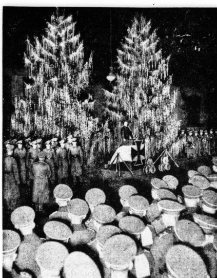
Das Wachregiment Berlin veranstaltete für seine Angehörigen eine eindrucksvolle Weihnachtsfeier

maerenen Hals illustriert ein breites Band aus feinen Perlen, und die Höschen sind mit großen Tropfen schöner Zierperlen geschmückt.