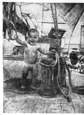
Der Braut im Alter von acht Monaten (Panama) Aus Erling Tambs, Hochzeitsreise - aber wie!

Den Rest der Nacht verbrachten wir in Gamboa, und am Morgen schickte uns eine Barkasse durch den Kanal. Wir wurden von einem Lotsen begleitet, der uns durch den Kanal führte. Die Fahrt war sehr ruhig, und wir konnten die Schönheit der Landschaft genießen.