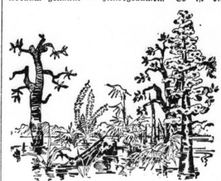
Der mitteldeutsche Urwald der Tertiärzeit

90 v. H. unter freiem Himmel in offener Grube gefördert. Wir kennen diese Gruben unter der Bezeichnung „Zagebau“. Um auf diese Weise die Braunkohle zu fördern, muß man zunächst die Decke aus Ton, Sand und Kies — Zagegrube oder Abraum genannt — hinwegräumen. Es ist ein