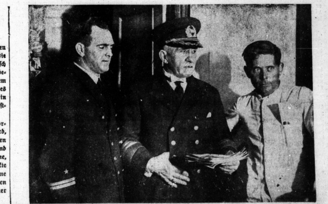
Ankunft des Dampfers „New York“ mit dem Kapitän und der gereinigten Mannschaft des norwegischen Dampfers „Sisto“