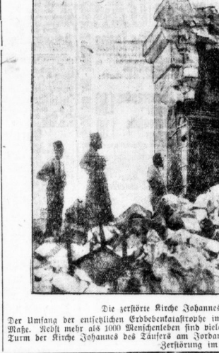
Die zerstörte Kirche Johannes des Täufers am Jordan.

Originalaufnahme von der Unglücksstätte.