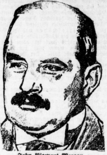
John Pierpont Morgan, der bedeutendste amerikanische Bankier, ist zur Erhaltung in Europa einflussreich. Morgan erhoht sich aber beim Geldverderben am besten. Also wird er auch in Europa einige Kreditverordnungen fassen.

Morgan in Europa. Der mächtigste Geldmann der Welt.