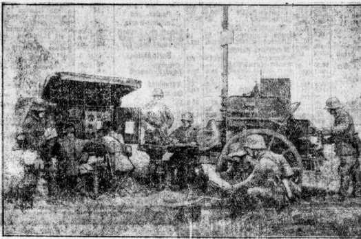
Leichte Panzerkeule einer reisenden Artillerie-Abteilung.