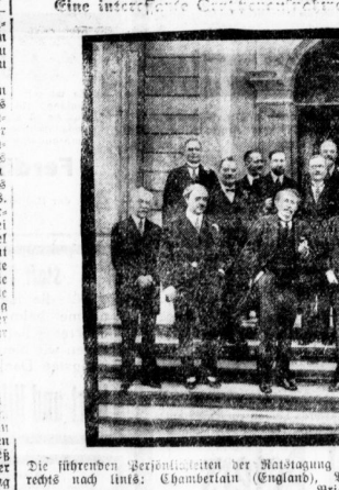
Die führenden Parteiführer der Nationalkongresse der Tagung des Arbeiterbundes in Genf...