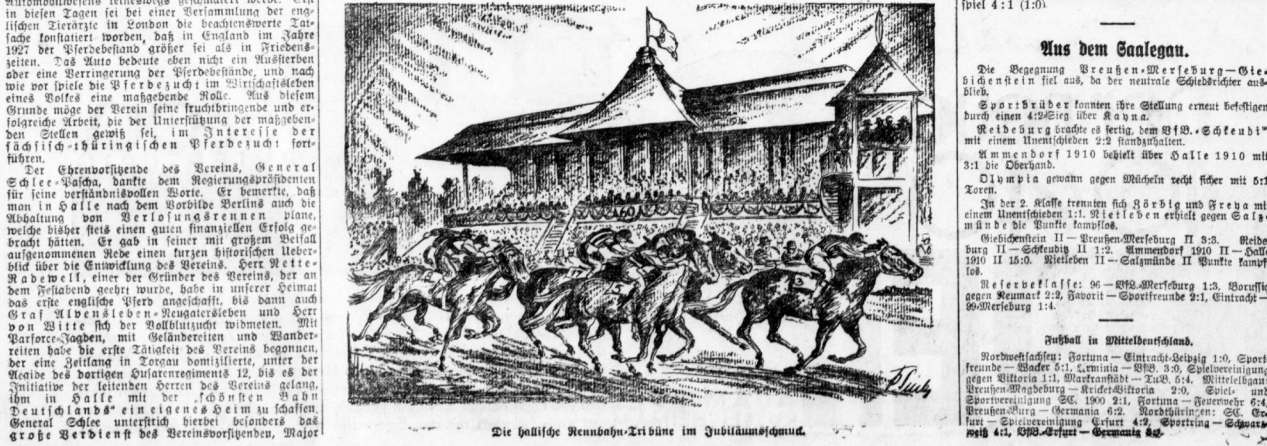
Die hollische Rennbahn-Tribüne im Jubiläumsturnier.

Das Jubiläumsturnier des Sächsisch-Thüringischen Renn- und Pferdevereins, das in diesen Tagen auf ein hohes Alter zu rückzuführen ist, fand mit dem Reiter des gefürchten Zeugnisses seinen Abschluss. Dem letzten hollischen Meeting dieser Saison, einem Jubiläumsturnier, war am Sonntagabend im Hotel „Stadt Hannover“ ein Fest vorausgegangen. Während die historische Bedeutung des hollischen Rennvereins durch die letzten Rennen, die durchweg einen Erosi boten, hinreichend dokumentiert wurde, dient die Veranstaltung des Jubiläumstages der geschichtlichen Repräsentation des Vereins, der sonst nur sehr selten „absteigt“.