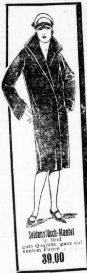
Seldempisch-Mantel It. Bild, gute Qualität, ganz auf buntem Futter 39.00

aus den Spezial-Abteilungen Konfektion u. Kleiderstoffe