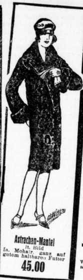
Astrachen-Mantel It. Bild in Mohair ganz auf gutem Astrachen-Futter 45.00

einzig dastehend in Bezug auf Qualität und Preis