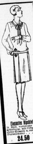
Elegantes Hipskleid It. Bild, vornehme Verarbeitung, mit Crêpe de chine, Hochfächerhemm mit bunter Stickerei 24.50

Eolienne Wolle mit Seide, doppeltreift in großer Farben- auswahl . . . . . Meter 3.75