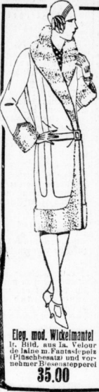
Eleg. mod. Wickelmantel It. Bild, aus Ia. Velour de laine m. Faserpelz (Pischschwaiz) und vornehmer Plüschapperei 35.00