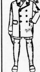
Pyjack It. Bild aus gutem marinen Stoff, m. warm. Futter u. Absteich., Gr. 0 = 10.50 Jede weitere Größe 60 Pf. mehr