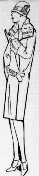
Eleg. Velour de laine Mantel It. Bild in mottig warmer Winter- ware mit groß. Pelzkr., extra wellig! 28.50

weil unsere Geschäftsräume dem riesig gesteigerten Geschäftsverkehr bei weitem nicht mehr genügen! Infolge Platzmangels während der Umbauzeit sind wir nun genötigt für schnelleren Abgang der Waren Sorge zu tragen. Wir bringen daher für alle Waren die billigsten und vorteilhaftesten Angebote!