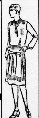
Eleg. Nachmitt. - Kleid It. Bild aus reinseidenem Gewe- de de chine, mit neuartig. Biesen- steperer, modernem Krage und 1 a p g u. Aermeln, mit un- merklichen Schötheile - Fehlern 22.75

III. Stock Unsere großangelegten Haushalt- u. Spielwaren-Abteilungen bieten die denkbar günstigsten Kaufgelegenheiten