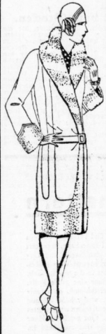
Eleg. mod. Wickelmantel It. Bild aus la Velour de laine, mit Fantasiepelz (Pflöschbesatz) und vornehmer Biesensteperer 39.00

Umbau = Aufbau = Fortschritt das ist unser gesamtes Wollen und unsere Kundschaft soll und wird der Nutznießer dieses Fortschrittes sein!