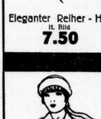
Eleganter Reiher - Hut It. Bild 7.50