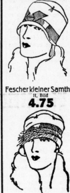
Fescher kleiner Samthut It. Bild 4.75