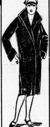
Seidenplüsch - Mantel It. Bild, gut u. qualitativ, ganz auf buntem Futter 39.00