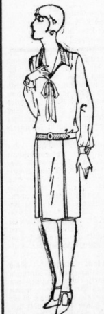
Reinwoll. Popelinekleid ähnlich wie Bild, in vielen mo- derneren Farben, mit Biesen und modernem Bunt. Biesen garniert 12.75