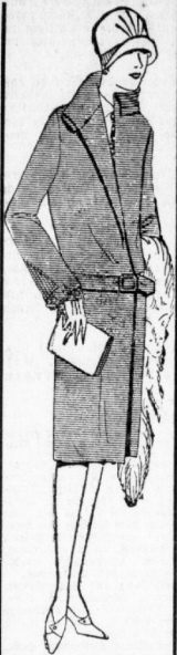
Fescher Winter-Mantel It. Bild aus Velour de laine, jugendlich verarb., schöne Farb. 19.75