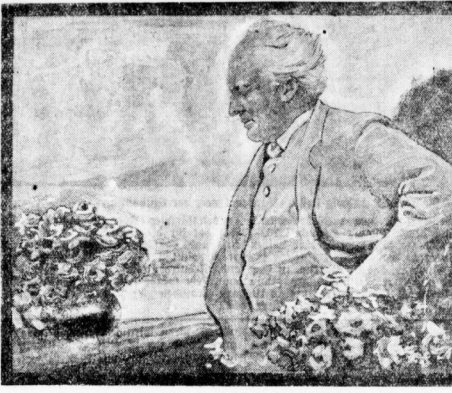
Gerhart Hauptmann vollendet am 15. November dieses Jahres sein 65. Lebensjahr. Unser Bild zeigt ein Gemälde von Josef Rod, das Dittion auf der Terrasse seines Wohnhauses in Napado darstellt.

10000 Dollar. Eine Jahreseinte zahlte der Agent aus jeder unglücklich schmerzigen Briefschleife sofort in bar aus.