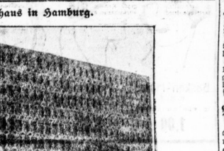
Ein Krieten-Bureauhaus in Hamburg.

Die jährliche Grundbesitzumschau eines modernen Büreau. Die jährliche Grundbesitzumschau eines modernen Büreau. Die jährliche Grundbesitzumschau eines modernen Büreau.