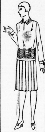
Kleid II. Bild aus guter reinwoll. Ware, mit mod. Sakeret und Blusen-Vorbereitung 10.00