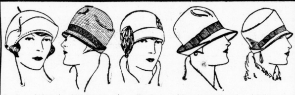
Basken-Mütze 1.00 II. Bild in vielen Farben Moderner Filz-Streifenhut 2.00 II. Bild Fesche Lindbergh-Kappe 3.00 II. Bild Breitrandiger Filzhut 3.00 II. Bild dunkl. Farb. Feiner Velour-Hut 5.00 II. Bild