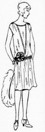
Kleid I. Bild aus gutem reines chines. in mod. hübschen Farben, fech verarbeitet 10.00

Versäumen Sie diese Gelegenheit nicht, um jetzt schon Weihnachtseinkäufe zu machen!