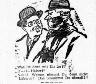
„Was ist denn mit Dir los?“ „H—H—Heiser!“ „Nanu! Warum nimmst Du denn nicht Lakerol?“

Lakerol ist von prominenten Persönlichkeiten empfohlen. Lakerol beugt Husten und Heiserkeit vor!