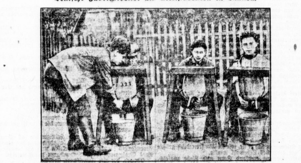
Die aus Deutschland und den hiesigen Industriefabriken...