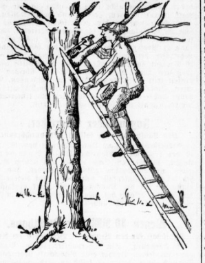
allein ist es wichtig, die Stämme mit einer Baumrinne oder der Traubrinne, der sogenannten Rindenrinne, gründlich zu reinigen. Besonders die Kriegen sind es, die alle möglichen Schädlinge und Kranheitskeime zu befeuchten, sie sind deshalb besonders eingehend zu bearbeiten, wie es unter Bild zeigt. Die Rinne muß möglichst auf ein bei der Arbeit darunter zu haltendes Seil ausgeleitet werden, um es nicht zu verletzen. Die oberste Rinne muß dann bis in die Nähe der Krone hinunter mit einem Holzbohrer ohne Kalk zu bohren. Man nimmt im Winter eine 20 bis 30 Proz. Emulsion, bei Frühjahrs nur etwa 15 Prozent. Es sei aber nochmals darauf hingewiesen, daß diese Mischung nur im Winter gegeben wird, im Frühjahr, etwa im Februar, gibt man dann einen Karbolsäuremischung. Und zwar gibt man etwa 15 Prozent bei Beginn der Arbeit, und 1 bis 1 1/2 Prozent Karbolsäure bis zum Ende der Arbeit. Die Rinne wird dann mit einem Karbolsäuremischung durch feinen feinen Sieb durchgeschüttelt. Die Rinne der behandelten Bäume wird dann mit einem feinen Sieb durchgeschüttelt. — Vor allem ist aber beim Einbau darauf zu achten, daß man kein Karbolsäuremischung verwenden, so würde man seinen Obstbäumen schweren Schaden zufügen.

Die Meinung mancher Gartenbesitzer, im Winter sei nichts an den Obstbäumen zu tun, ist durchaus falsch. Gerade der Winter ist am besten dazu geeignet, die Rinde zu pflegen. Schädlinge, die sich in den Kriegen mit uns, was zu geschähen hat, so ist darauf zu achten, daß die Rindenpflege der Obstbäume einen breiten Raum bei den Winterarbeiten einnimmt. Vor