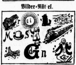
Kaufmann des Bilder-Märchens. Bei der Arbeit recht bequemer, beim Gehehen reicher Bekleid.