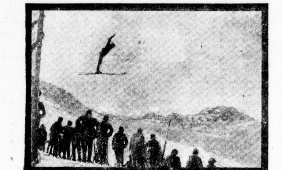
Der fliegende Mensch. Eine prächtige Aufnahme aus dem Winterortort in der Schweiz; Zählung von der Bar end-Ende.