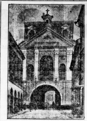
Das berühmte Einfallstor der Wägenzüge in Wilsa.