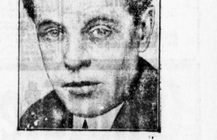
Max Pallenberg, der berühmte deutsche Komiker, gestorben am 18. Dezember 1927...