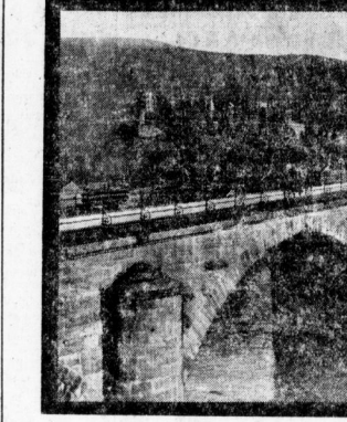
Die alte Heidecker Klosterkirche, eine der ältesten und schönsten Kirchenbauten Deutschlands, ist dem modernen Verkehr nicht mehr gewachsen und soll umgeändert oder abgetragen werden.