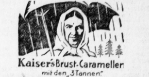
Kaisersbrust-Carameller mit den „3 Tannen“ schätzen sie sich vor Erkältung, Husten und Katarrh! - Weiter hinten, schmecken von Käse, Karamell und Kakaobitter, wenn sie dieses seit 35 Jahren bewährte Hausmittel bei sich haben, schmecken und nicht verschlingen Sie damit Husten, Heiserkeit, Katarrh, Verschleimung, Hal, Kopf, Dose 50 Pf. Zu haben in Apotheken, Drogerien und wo Plakate sichtbar.

Langsam ging Hans Holtenan am Rande des Häußchens dahin. Seine Gedanken arbeiteten unablässig. Noch keinen Schritt war er weiter. Nicht den geringsten Anhaltspunkt bot er, wo er die wertvollste Schatzkiste zu finden hätte. Er hatte, einem der berühmtesten Kriminalbeamten Auftrag gegeben. Privat. Doch es kam immer wieder auf dasselbe heraus. Wenn man weiter wollte, mußte man Sonja Rotoff zum Sprechen bringen. Vorläufig war das aber ganz ausgeschlossen und so war eben jetzt jeder weitere Schritt vergeblich. So waren ihm vorerst die Hände gebunden. Zudem merkte er auch, daß der Beamte nicht das nötige Interesse für den Fall hatte. Er glaubte nie und nimmer an eine Unschuld Sonja Rotoffs, das hatte Holtenan aus jeder Unterredung heraus gefühlt. Schon wurde das Kind gelb. Die Sonne schien jedoch noch warm und hell. In den Gärten stierte noch ab und zu zwischen all den Herbstblumen eine letzte Rose. Am Waldrand lauerte eine alte Frau. Sie hielt ihre eine schmutzig-braune Hand entgegen.