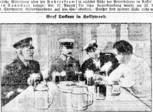
Graf Ludwiger von Hohenhausen.