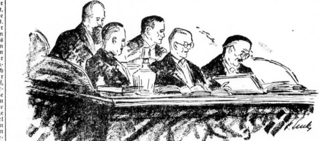
Die Sachverständigen im Stadtbankprozeß.