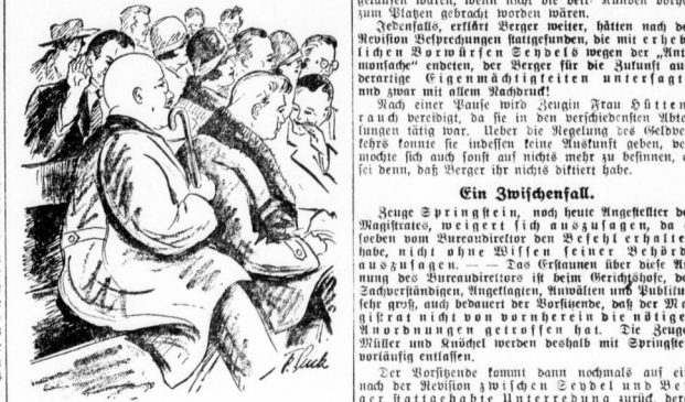
Die Besprechung! Wird in den Jahrbüchern.

Die Besprechung Bergers wurde gestern durch ein kleines Innenministerium unterbrochen. Einige für den vierten Verhandlungstag geladene Zeugen sollten vernommen werden.