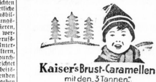
Kaisers Brust-Garamellen mit den 3 Tannen.