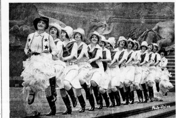
Die „Miserable-Nach-Girls“ tanzten vor dem Nationaldenkmal in Berlin Westfalen!