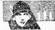
Kaisers Brust-Caramellen mit der „Janner“