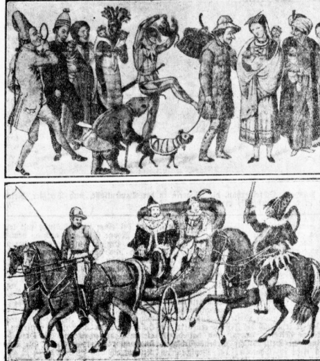
Oben: Karnevalsanzug im päpstlichen Rom 1928. Unten: Köstliche Karnevalsanzüge 1824. Schon vor hundert Jahren hat Prinz Karneval — in den Festtagswästen zwischen Freizeitspaß und Mädelnwitz — mit derselben Kraft und Ausgesprochenheit regiert wie heute.

Ihr Haar strömte einen feinen, verblühenden Duft aus. Er amete ihn und dachte, daß er ihm fante, daß er irgendwam und irgendwo sich schon an ihm bezaubert hatte. „Der bist du?“ forschte er erregt. „Eine Zuseherin. Sieh dich, daß du deine Seele rettest!“ „Sie schwebten wie im Wahn dahin. Standen noch im Traum in der Mitte des Saales, als der Tanz zu Ende war. Kommen erit in über zur Bekundung, als Wilbert zu ihnen trat. Mit seinem milden Lächeln, das auch den barnadäglichen Blödsinn aus der Fassung bringen konnte. Er hatte, wie gesagt, die fatale Angewohnheit, immer gerade dann in Erscheinung zu treten, wenn er durchaus überflüssig war.“