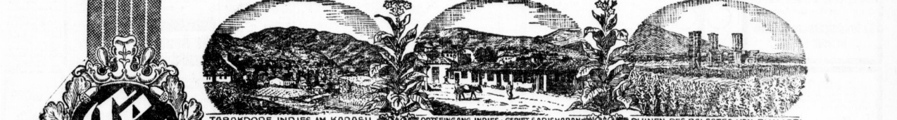
TABAKDORF JUNDJES AM KARASU... ORTSGEMEINSCHAFT JUNDJES-GEBIET SARISHABAN... RUJINEN DES PALASTES VON PHILIPPI.

Text regarding the German World Society, possibly a travel or insurance organization.