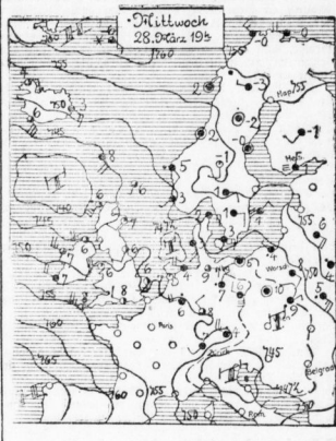
ERLEUTERUNG: Druckzentren (Hoch- und Tiefdruckgebiete), Windrichtung und -stärke (Pfeile), Regen (Schraffur), Schneefall (gestrichelte Linien), Nebel (gestrichelte Linien), Wolken (gestrichelte Linien), Temperatur (gestrichelte Linien). Die Pfeile zeigen die Windrichtung an. Die gestrichelten Linien zeigen die Temperatur an.

Das Niederdrückgebiet, das am Mittwoch über Mitteldeutschland hinwegzieht, im flachen Regen, auf dem Boden etwas Schnee brachte, entfernt sich nach Nordosten. Unser Gebiet gelangt damit in den Bereich einer Zisterne, die mit Temperaturen von etwa 5-7 Grad aus Nordwesten herankommt und eine durchdrachte Stille mit sich führt. Barometertendenz im Bereich dieser Strömung läßt vorübergehend auch für unser Gebiet aufsteigen der ostende und etwas freundlichere Stimmung erwarten. Vor Schottland und Irland aber liegt ein neues Strömungsgebiet, das mit geringer Geschwindigkeit gegen Mitteldeutschland treibt und gegen Ende der Woche unser Gebiet abermals energisch gefallen dürfte. Die Temperaturen werden zunächst keine wesentlichen Veränderungen. Aufstiege: Nach vorübergehendem Aufklaren wieder Zunahme der Bewölkung und von neuem aufkommende Neigung zu Niederschlägen.