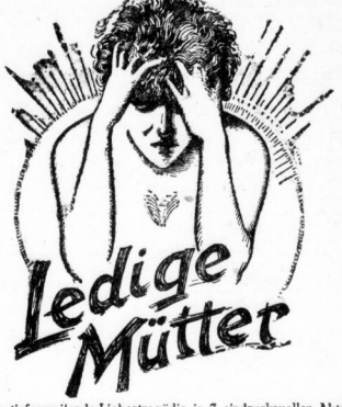
Eine tiefergreifende Liebestragödie in 7 eindrucksvollen Akten.

Zum Feste nur das Beste! Ein Filmwerk von hinreißender Stoßkraft! Jeder ist es sich schuldig, diesen Film zu sehen, dessen brennendes Interesse Millionen von Menschen angeht!