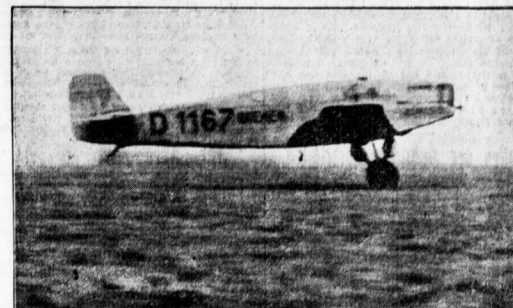
Der Start der „Bremen“ in Balhoonnet. (Das einzige Startbild.)