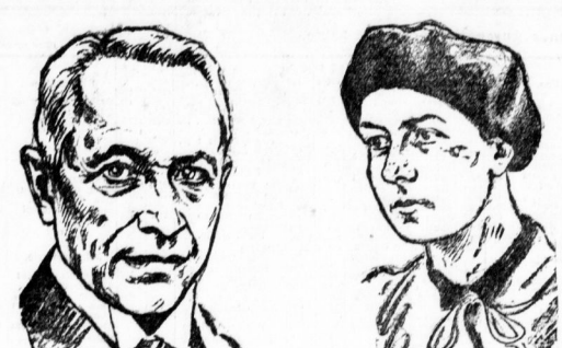
Prof. Hans Junkers, der Erbauer der Zeppelinluftschiffe.