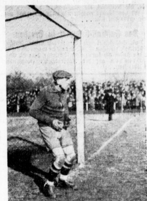
In Erwartung des Halles. Eine Szene aus dem Weichheitsstempel Wader — Germania-Halbfinale.

Trotz des schweren Wetters und trotz der folgenreichen Bedeutung des Spieles fand man kein Niveau innerhalb recht schärfen. Wir sind jedoch nicht ohne Grund der unteren Wader, aller unterer Zueinanderhaltung wiederum zu der Erkenntnis gekommen, daß hier durchaus nicht die schlechtesten