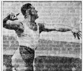
Hirschfeld wurde bei den Olympiakämpfen Dritter im Ringen.