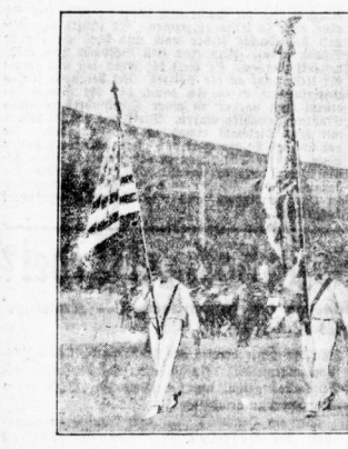
Einszug der amerikanischen Teilnehmer.

Dreitausend deutschstämmige Amerikaner kamen als Delegation ihrer Vater auf und an den Tag teilgenommen. Im Vordergrund unter amerikanischer