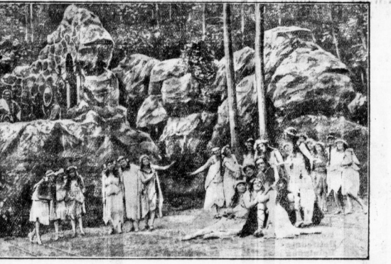
Szene aus der „Porfilla“-Aufführung.