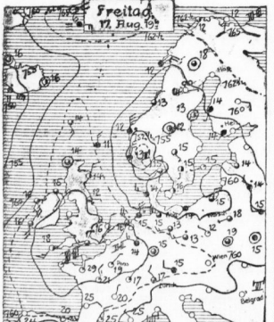
ERLEBUNG: Unvorstellbar schnelle Abfälle...