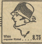
Wien eleganter Filzhut . . . . . 8.75