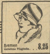
Bremen vornehme Filzhaube . . . . . 8.25