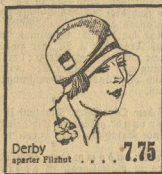
Derby sparter Filzhut . . . . . 7.75