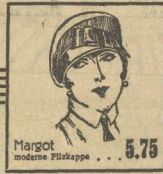
Margot moderne Filzkappe . . . . . 5.75