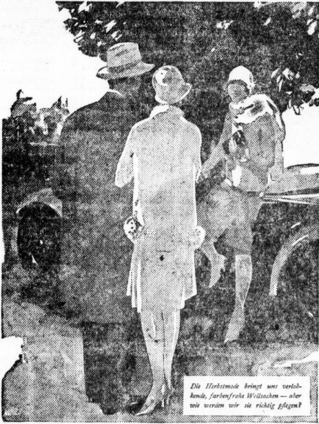
Die Herbstmode bringt uns verlockende, farbenfrohe Wollkleider — aber wie werden wir sie richtig pflegen?