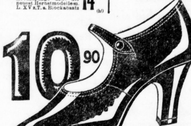
Prima Lackspangenschuh Lederfutter sch. L. XV. A. 2.

Herr schwarze Schnürstiefel 1 490 in hoch u. krassen Häutchen Kammararbeit Kreuzspang usw. die neueste Herstellungsweise. deutscher Fabrikat.