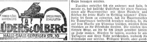
HALLE-SAALE/LEIPZIGER STR. 30

Am 22. Juli wurde die Bahnlinie eingeweiht. Am 23. Juli mittags traf der Dampfzug, von der Lokomotive „Galina“ gezogen, an dem hiesigen Bahnhof ein. Dieser erste Dampfzug war nicht der letzte, der „Galina“ es war ein einzelner, fahrender Zug in einem mittelalterlichen Hofbau, 1856 wurde er bereits abgebrochen. Eine unglückliche Zwischenbegegnung hatte sich am 1. August 1840 ereignet. Am 22. Juli wurde die Bahnlinie eingeweiht. Am 23. Juli mittags traf der Dampfzug, von der Lokomotive „Galina“ gezogen, an dem hiesigen Bahnhof ein. Dieser erste Dampfzug war nicht der letzte, der „Galina“ es war ein einzelner, fahrender Zug in einem mittelalterlichen Hofbau, 1856 wurde er bereits abgebrochen. Eine unglückliche Zwischenbegegnung hatte sich am 1. August 1840 ereignet.