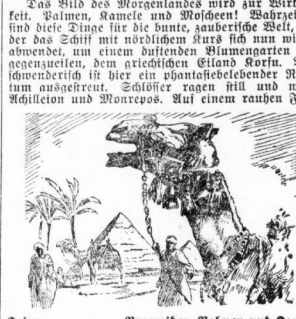
Pyramiden, Palmen und Kamele