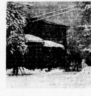
Hallische Skisportler am Sonneberger Wegehause bei St. Andreasberg.

Thüringer Wald. Der Winter auf den mitteldeutschen Gebirgsflanken ist von glänzendem Schmuck, von der der Städte im Hochland kaum etwas abgibt. Dabei flingt auf dem Thüringer Wald, dem Harz, dem Erzgebirge und den umliegenden Gebirgsflanken ein völlig anderes Winterbild als auf dem rauheren Harz. Das Erzgebirge aber auf den Höhen des Harzes.