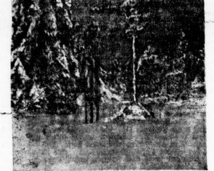
Skikreuz am Bruchberggebiet

Der Winter auf den mitteldeutschen Gebirgsflanken ist von glänzendem Schmuck, von der der Städte im Hochland kaum etwas abgibt. Dabei flingt auf dem Thüringer Wald, dem Harz, dem Erzgebirge und den umliegenden Gebirgsflanken ein völlig anderes Winterbild als auf dem rauheren Harz. Das Erzgebirge aber auf den Höhen des Harzes.