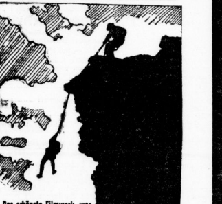
Das schönste Filmwerk, was Menschenaugen je gesehen!