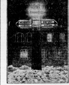
Begleiter mit elektrischer Beleuchtung wurden auf den Ausfahrten von Thüringen erdichtet.