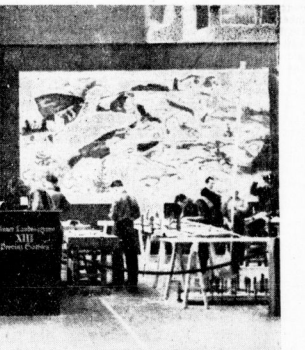
Die Arbeitsstände der Flieger-Landesgruppen XIII und XIV in den Berliner Tennishallen.