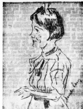
Originalzeichnung: Kurt Wartha. Die Zille-Type Marietta Lenx