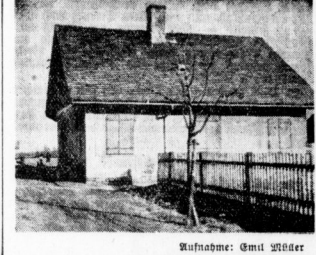
Das alte Chausseehaus bei Görschen