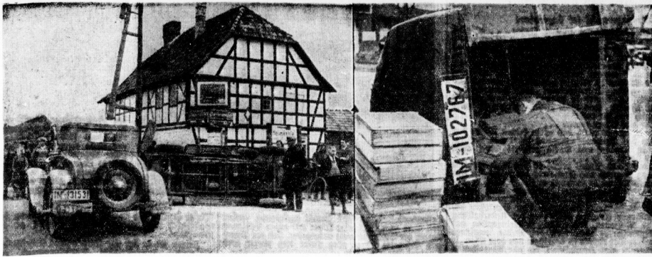
Die Unfallstelle ist eine gefährliche Kreuzung, da sie sehr unübersichtlich ist