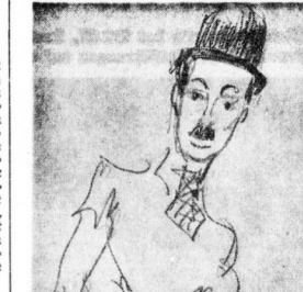
Originalzeichnung: Kurt Wartha. Kauschkuchens der Truppe 'Vier Richey'