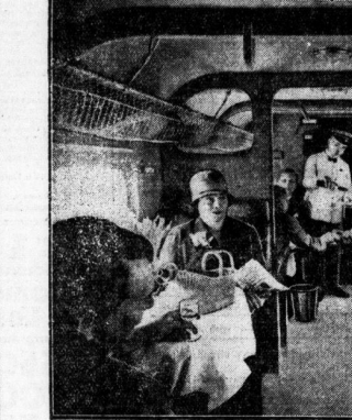
Speifewagenbetrieb im „Germania“-Hilgung.