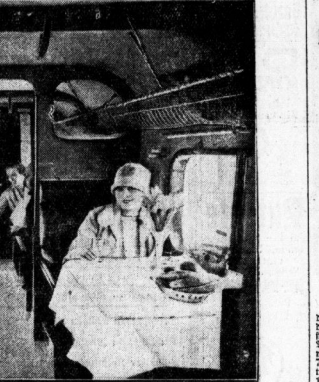
Speifewagenbetrieb im „Germania“-Hilgung.