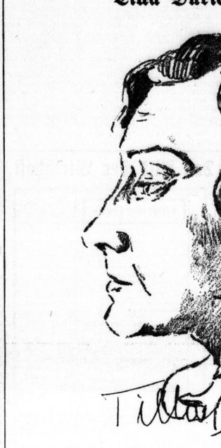
Originalzeichnung von Hans Jürgens Kallmann aus Entsch des Geheißes der Künstlerin am hallischen Stadttheater.