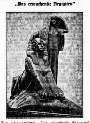
„Das erwachende Ägypten“

seinem Bruder hinab, der auf der Hausbank saß und den Fingern zitterte. Als der zweite Müller die Schrift gelesen hatte, sagte er: „Bürdigen müßten wir es mit allen Sinnen.“