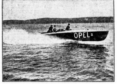
Opel II, der Favorit

Ausgleich dieser Niederlage gegeben. Weiter spielen Zu. Frieden-Weisklasse Meistert. gegen Wäuer-Weisklasse Meistert. Ueber die Spielstärke dieser beiden Mannschaften sind wir nicht informiert. Gut die Frieien doch wieder ihre alte Mannhaftigkeit belammten, sollte ihr ein fröpper Sieg gelingen. Einen Endspieler kann man bei der Ausgeglichenheit der Gegner nicht voraussehen.