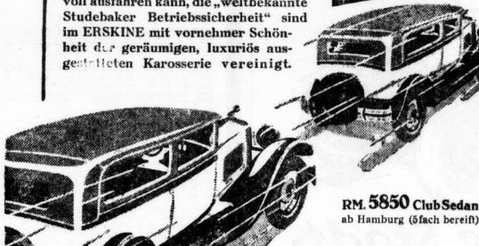
RM. 5850 Club Sedan ab Hamburg (6fach befrist)

Verblüffendes Anzugmoment, Höchstgeschwindigkeit, die man kaum jemals voll ausfahren kann, die „weltbekannte Studebaker Betriebssicherheit“ sind in ERSKINE mit vornehmer Schönheit der geräumigen, luxuriös ausgestatteten Karosserie vereinigt.