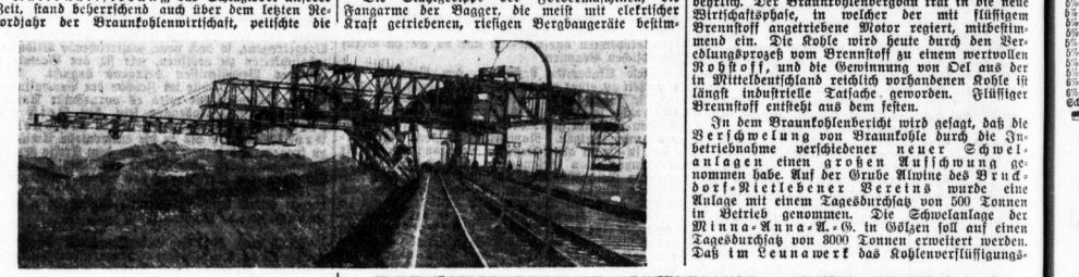
Schiffswerke weiter empor. Gegenüber dem Vorjahresergebnis von 139 Millionen wurde die Förderung um 5,4 Prozent...