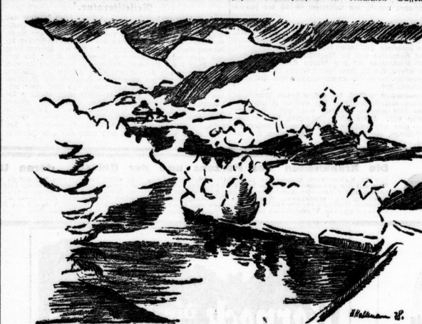
Matten und Seen im Allgäu-Land