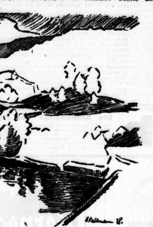
Original-Studie von H.-J. Rallmann