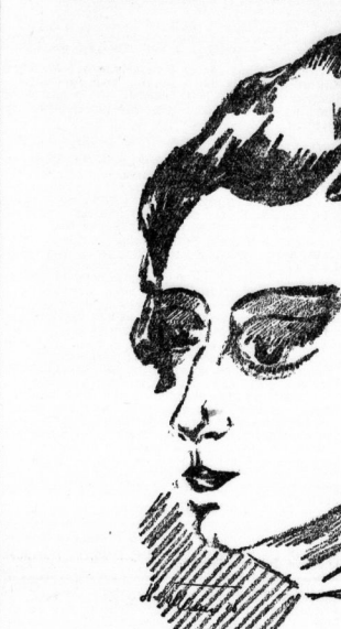
Originalmalerei von G. J. Kallmann, von der Künstlerin signiert (vgl. das Genestück dieser Nummer).