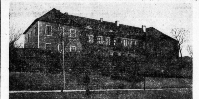
Schloß Wilsleben, das guttätigste Heim der Jugend