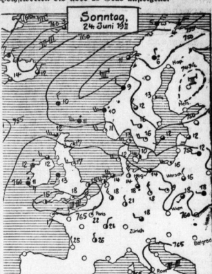
Sonntag, 24. Juni 1926. Wetterbericht...