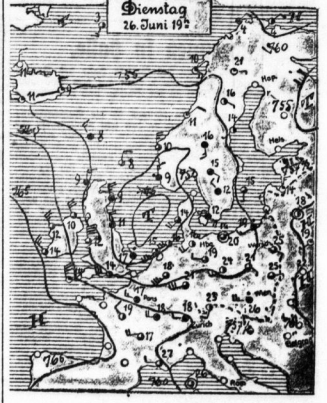
Erklärung: Geometrische Höhe (in Metern) ist durch die Zahlen angegeben. Die Zahlen sind die Höhen in Metern. Die Zahlen sind die Höhen in Metern.

Ein Tiefdruckgebiet wandert von England über die Nordsee nach Skandinavien weiter. Nachdem es sich auf seiner Nordwärtsreise ein wenig festgesetzt hat, wird es am Dienstag bei großer Schwüle endlich einmal bis auf Sommerwärme aufliegen. Die Temperatur der Luft wird sich auf 20 bis 22 Grad Celsius erhöhen. Die Luftfeuchtigkeit wird sich auf 70 bis 80 Prozent erhöhen. Die Temperatur der Luft wird sich auf 20 bis 22 Grad Celsius erhöhen. Die Luftfeuchtigkeit wird sich auf 70 bis 80 Prozent erhöhen.