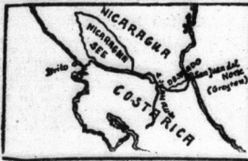
Ein Kanal zwischen dem Atlantik und dem Pazifik durch Nicaragua