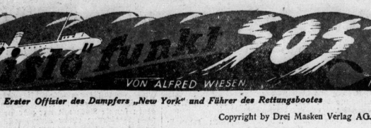
Erster Offizier des Dampfers „New York“ und Führer des Rettungsbootes