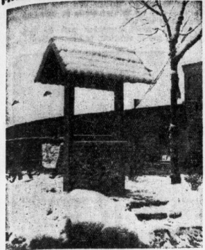
Alter Brunnen im Hof des Schlosses Hohenturm