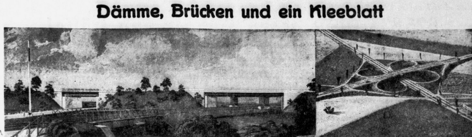
Das erste unger beiden Schaubilder von Baulichkeiten der Reichsautobahnen im Gebiet der Obersten Bauleitung Halle zeigt in eindruckvoller Weise, wie sich der Damm der Reichsautobahn Hildesheim-Halle-Leipzig-Dresden in den beiden Brücken H 17 und H 18 bei Peßden dem Landschaftsbild einfügen wird; bemerkenswert sind insbesondere auch die Grünanlagen an den Dämmen. Das zweite Bild stellt die sogenannte Klebbauweise dar, die in der Umgebung der Reichsautobahnen Hildesheim-Breslau und München-Berlin bei Scheukwitz ermöglicht wird.