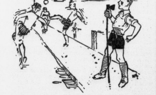
Zeichnung von Gott Reiter.

gelegt, aber immerhin noch brauchbare Tennisbälle zu haben ist. Am Viktoriaplag ist solch ein "kleines Ganzes"