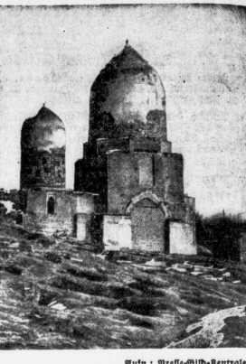
Auf dem Turm der Moschee des Scheich-Sabza (links im Bilde) im Kern Turkestan befindet sich eine Reihe riesiger Hakenkreuze. Ihre Vorkommen in dieser weltlichen Oegend ist für die Geschichte der uralten arischen Zeichens von großer Bedeutung.