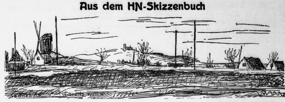
Sennewitz mit dem Petersberg im Hintergrund