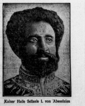
Kaiser Haile Selassie I. von Abeckinnien

den Weg gestellt haben. Und in der Zeit haben sich die Engländer gelang, das Abeckinnien für Europaer auf die Dauer nicht zu halten. Die Hindernisse liegen im Land und in dem Charakter, den diesen den Bewohnern angeordnet hat. Abeckinnien ist eine Palatirer-Raza. Galtische Züchtung hat riesige Flecken angenommen, die ganz unvermittelt mitten aus der indischen Ebene emporkommen. Kein Weg führt von der Ebene auf diese Burg hinauf. Denn über ist das Plateau wieder durch tiefe Schluchten zerfallen, so daß das Land selbst sich wieder in einzelne Festungen auflöst. Deshalb konnte sich in Abeckinnien auch so lange Zeit eine Herrschaft von Stammesfürsten behaupten. Wenn diese Fürsten nun gar untereinander einig sind und von einem kraftbewehrten Negus Negesti geführt werden, dann ist Abeckinnien so gut wie unüberwundbar. Das ist das Geheimnis seiner unsterblichen Geschichte. Es kommt hinzu,