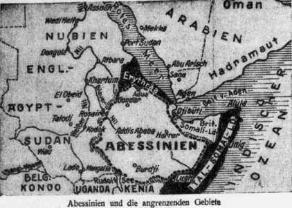
Abyssinien und die angrenzenden Gebiete

Abeckinnien hat sich innerhalb des vollständig kolonialisierten afrikanischen Gebiets eine Sonderstellung bewahrt: es ist noch heute völlig selbständig, es hat eine monarchische Staatsform, und seine Religion ist das Christentum. Überdies hat es keine Geschichte, so heißt man, das es zu weit wie keine Veränderung durchgemacht hat seit dreitausend Jahren! Der uns allen noch erinnerliche Kaiser Menelik II.